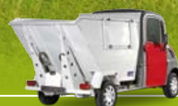
Version benne à déchets

➤ CHARGE ET VOLUME UTILES : Jusqu'à 680 kg - Jusqu'à 3 m 3