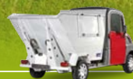
Version benne à déchets

➤ CHARGE ET VOLUME UTILES : Jusqu'à 680 kg - Jusqu'à 3 m 3