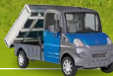
Version benne basculante