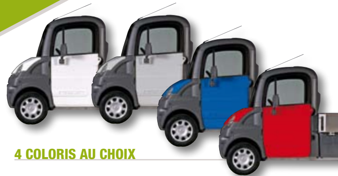
4 COLORIS AU CHOIX