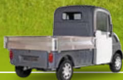
Version plateau ridelles